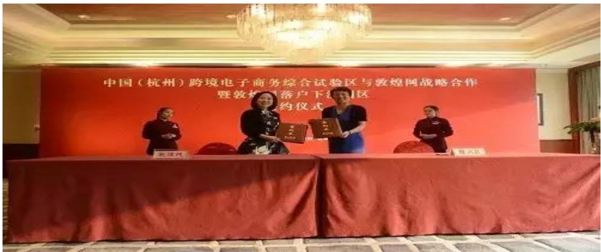
杭州经济技术开发区管委会与敦煌网签订合作投资协议

敦煌网将在开发区投资建设“敦煌网跨境外贸综合 3.0 平台”项目，5 年内将实现服务外贸企业超过 2000 家。