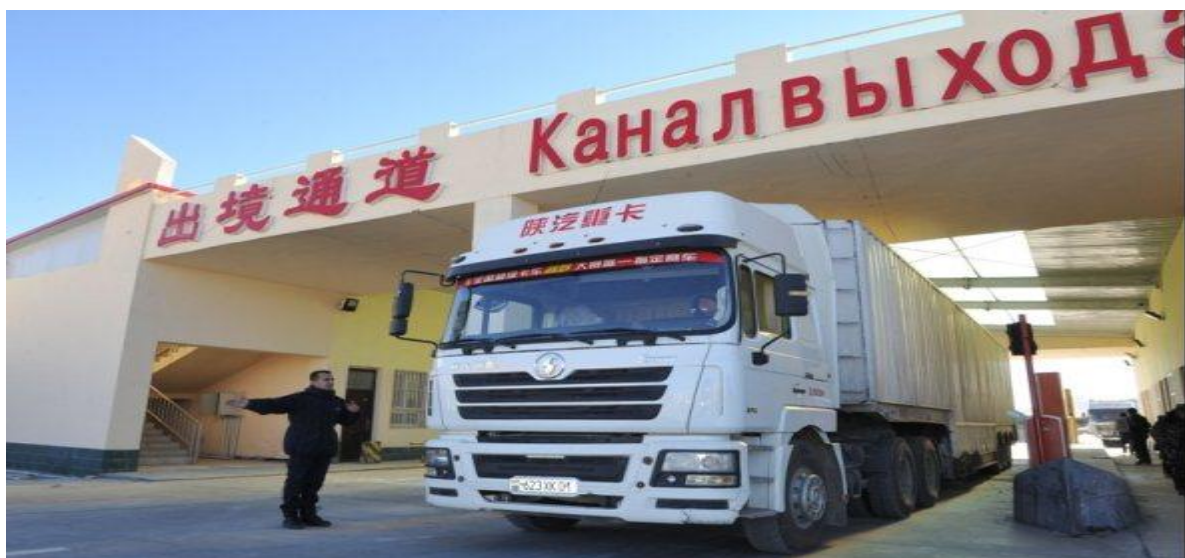
图为：卡拉苏海关关员验放当日首辆出境车辆

近日乌鲁木齐海关对外通报，从 12 月 1 日起，中国与塔吉克斯坦共和国唯一陆路口岸——卡拉苏口